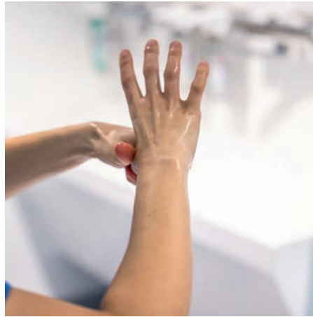
Hygienische Händedesinfektion durchführen.